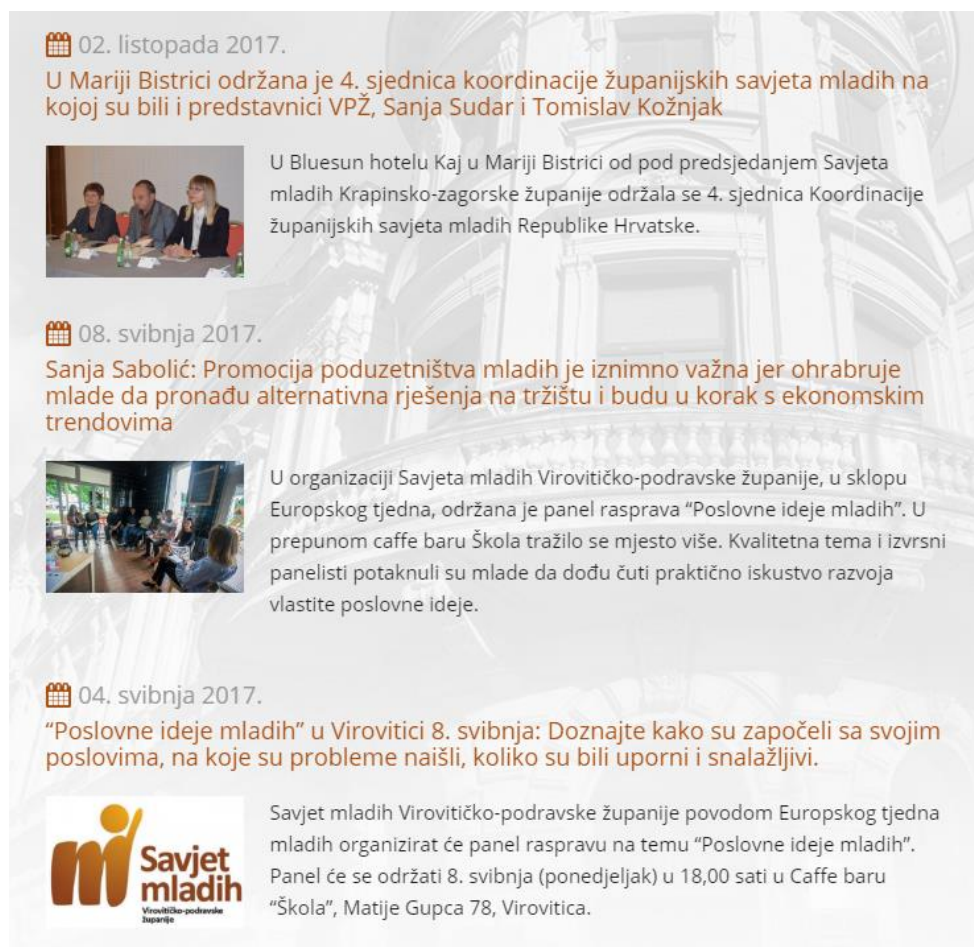
Slika 12. – Internetska stranica Savjeta mladih

Kako bi imali poseban i odvojeni komunikacijski alat s mladima, otvorena je i službena e-mail adresa Savjeta mladih Virovitičko-podravskе županije savjet.mladih@vpz.hr .