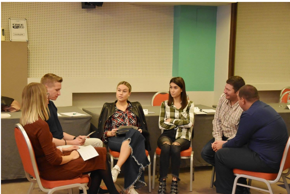
Fotografija 6. – 4. Sjednica Koordinacije županijskih savjeta mladih