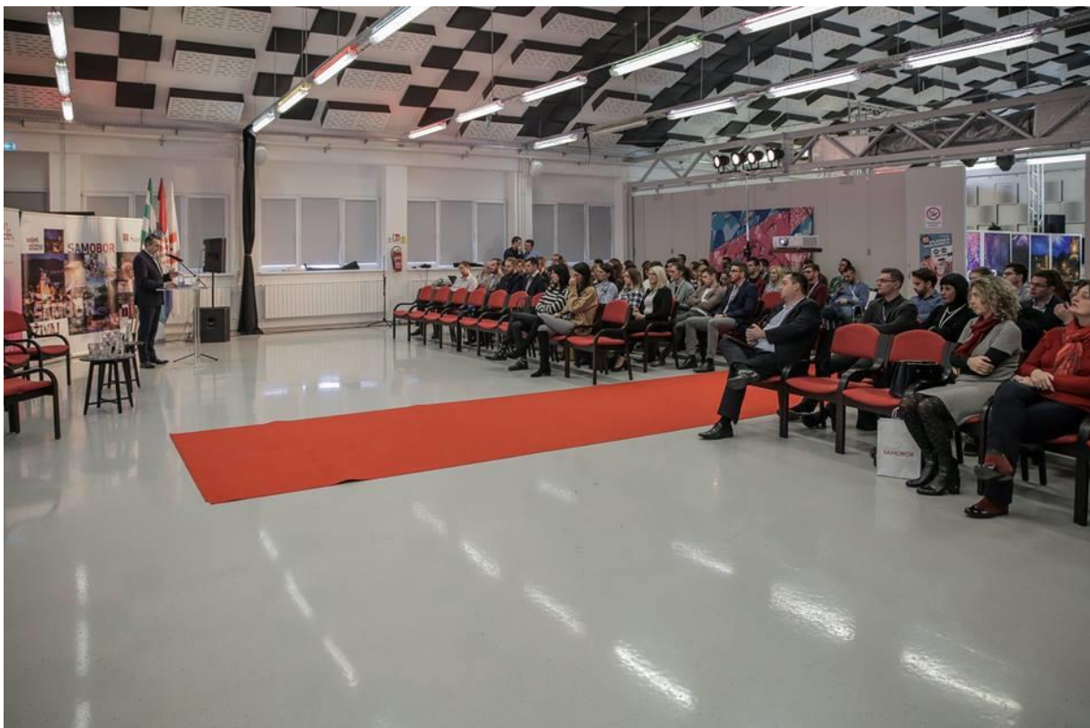
Fotografija 8. – Nacionalna konferencija savjeta mladih Republike Hrvatske

Program u subotu u potpunosti je bio posvećen aktualnom Zakonu o savjetima mladih. Nakon uvodnog predstavljanja i panel rasprave relevantnih gostiju na temu zašto je Zakon baš takav i što bi moglo bolje, članovi savjeta mladih mapirali su ključna pitanja oko eventualnog poboljšanje aktualnog Zakona te ponudili konkretna rješenja. Prijedlozi i zaključci uputit će se resornom ministarstvu s ciljem poboljšanja. Sve aktivnosti konferencije održavale su se u prostorima centra za mlade Bunker, najvećeg centra za mlade u Hrvatskoj.