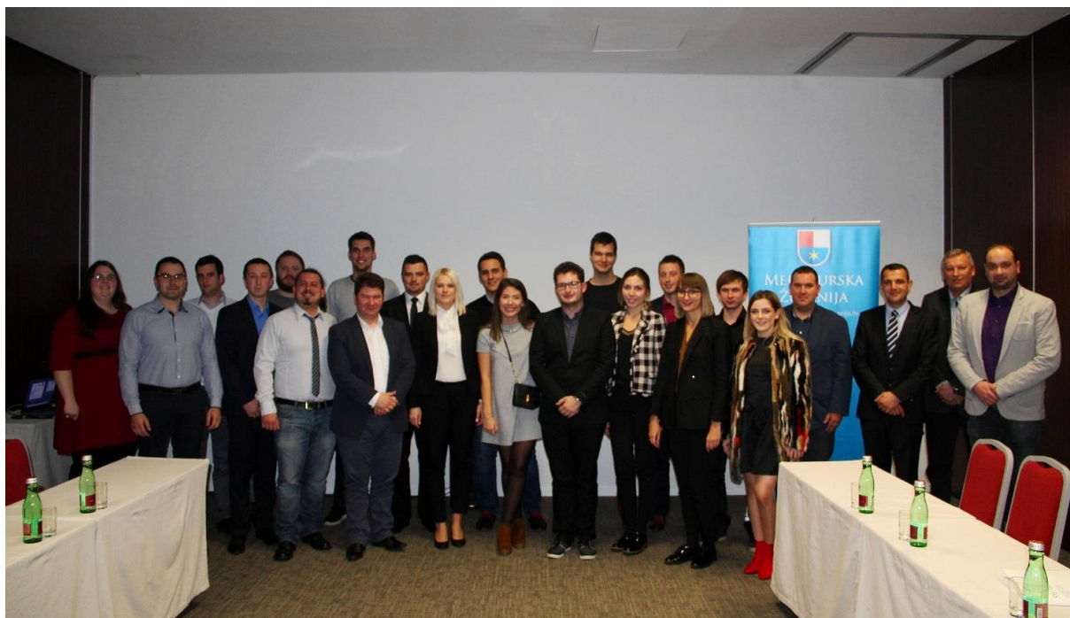
Fotografija 9. – 5. sjednica Koordinacije županijskih savjeta mladih

Na sjednici je izglasan program rada za narednih 6 mjeseci, koji uključuje objavu natječaja za izradu logotipa Koordinacije, nastavak ostalih aktivnosti u stvaranju vizualnog identiteta Koordinacije te završetak prikupljanja mreže podataka o gradskim i općinskim savjetima mladih. Također, formirane su preporuke nadležnim institucijama kako bi se stvorile bolje pretpostavke za osnivanje i kvalitetan rad savjeta mladih, te je izglasana podrška zaključcima s Nacionalne koordinacije savjeta mladih RH održane u Samoboru početkom prosinca.