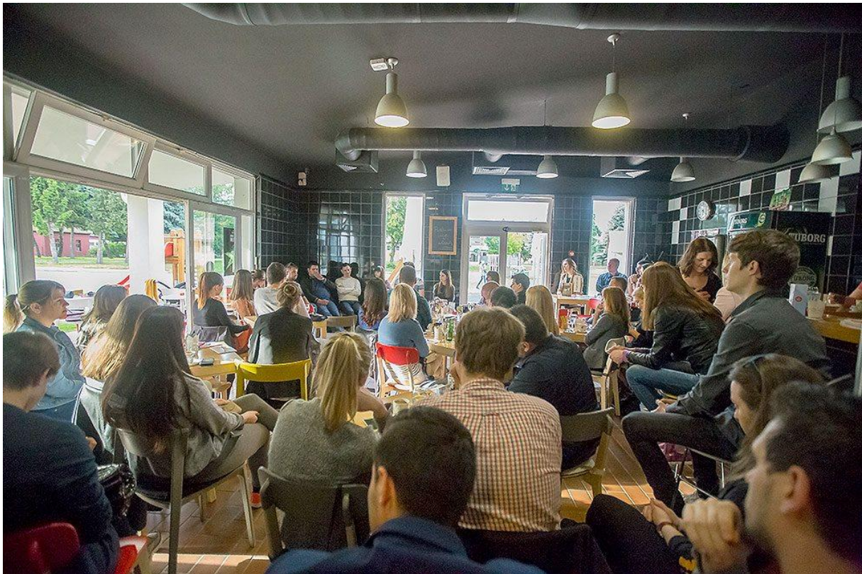
Fotografija 2. – Poslovne ideje mladih