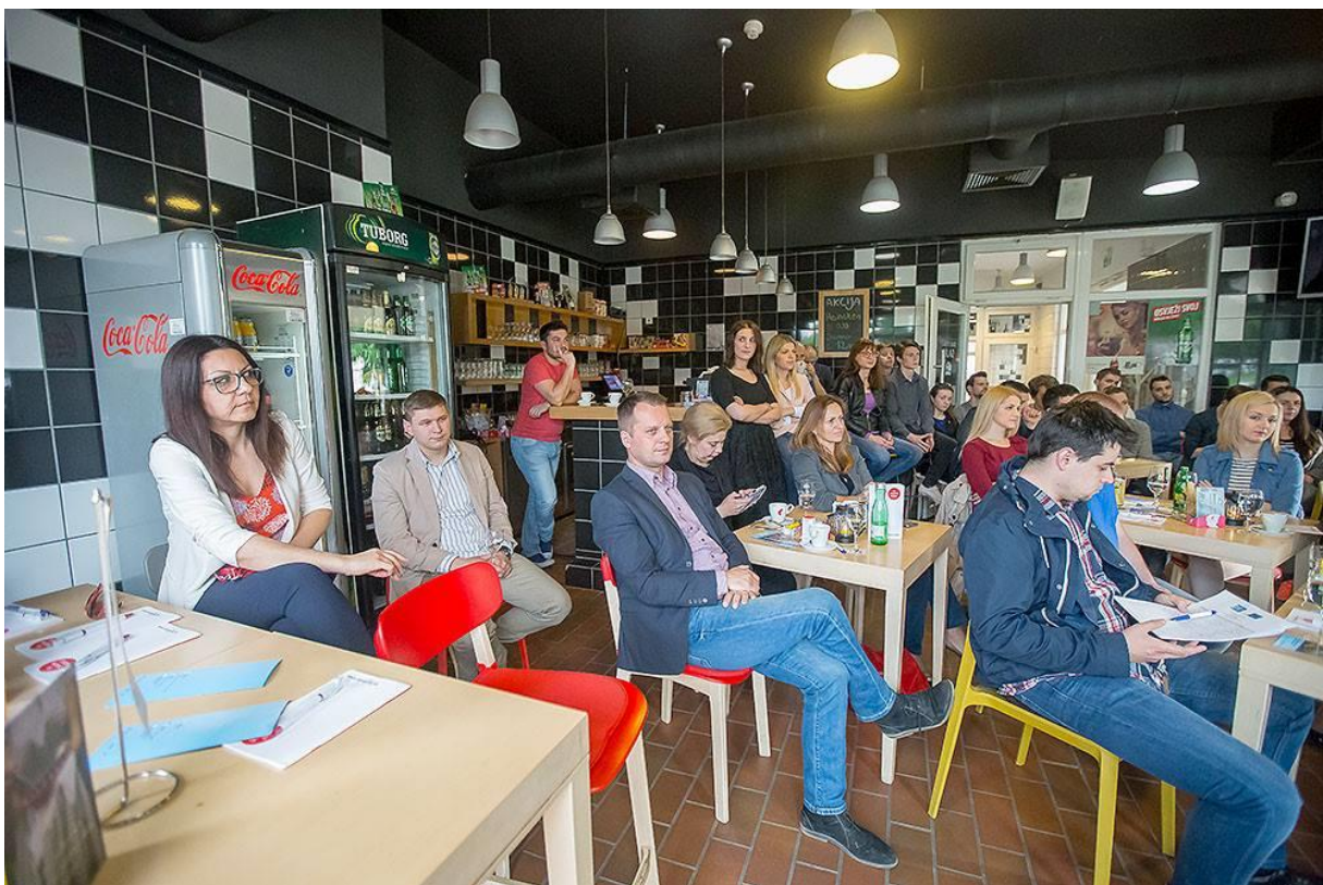
Fotografija 3. – Poslovne ideje mladih