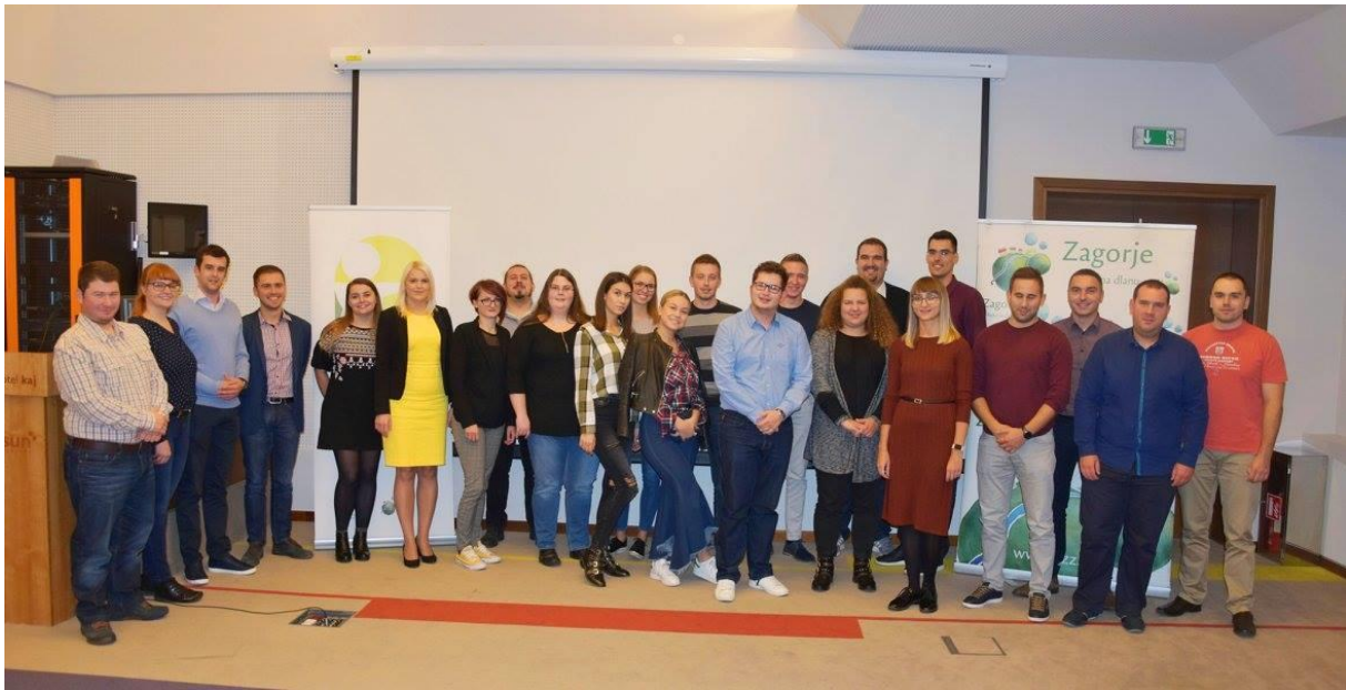
Fotografija 5. – 4. Sjednica Koordinacije županijskih savjeta mladih