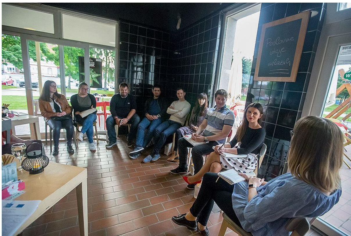
Fotografija 1. – Poslovne ideje mladih

Nakon panela organizirano je druženje uz degustaciju europskih jela koja su pripremili učenici Industrijsko-obrtničke škola Slatina i Strukovne škole Virovitica.