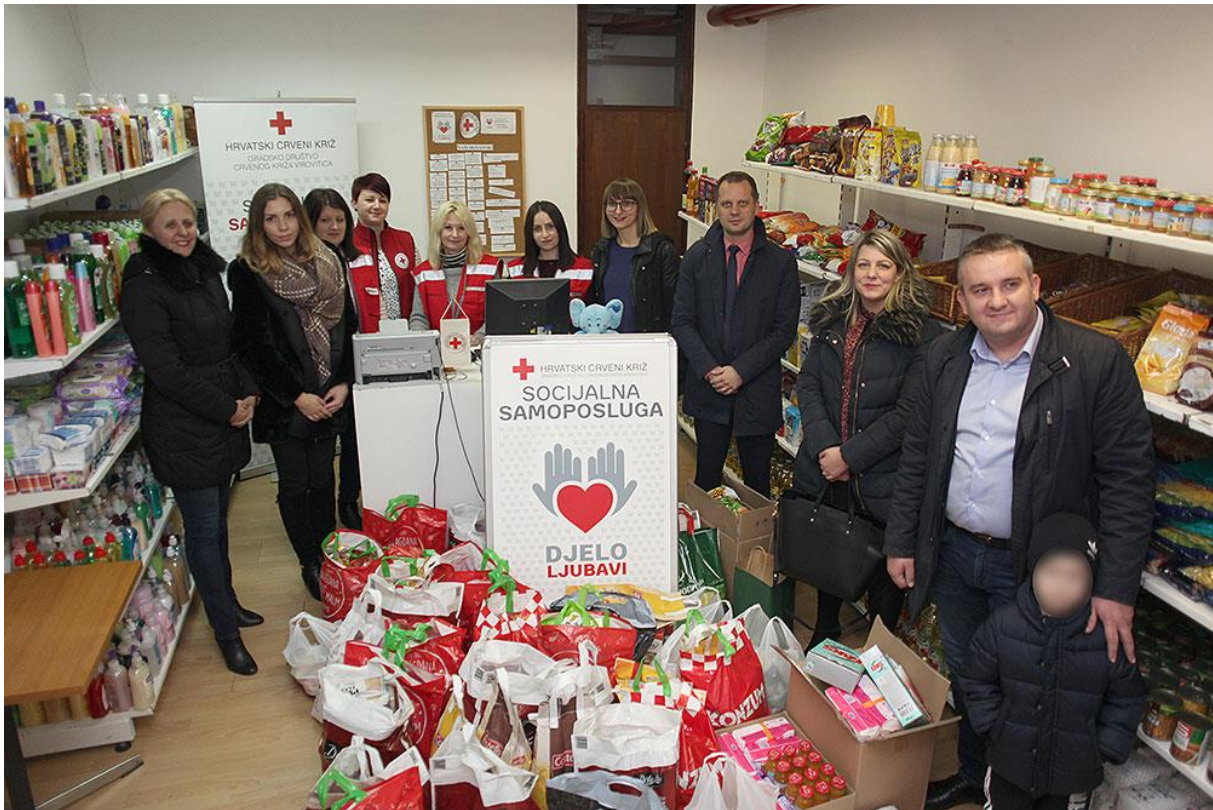
Fotografija 11. – Božićna humanitarna akcija