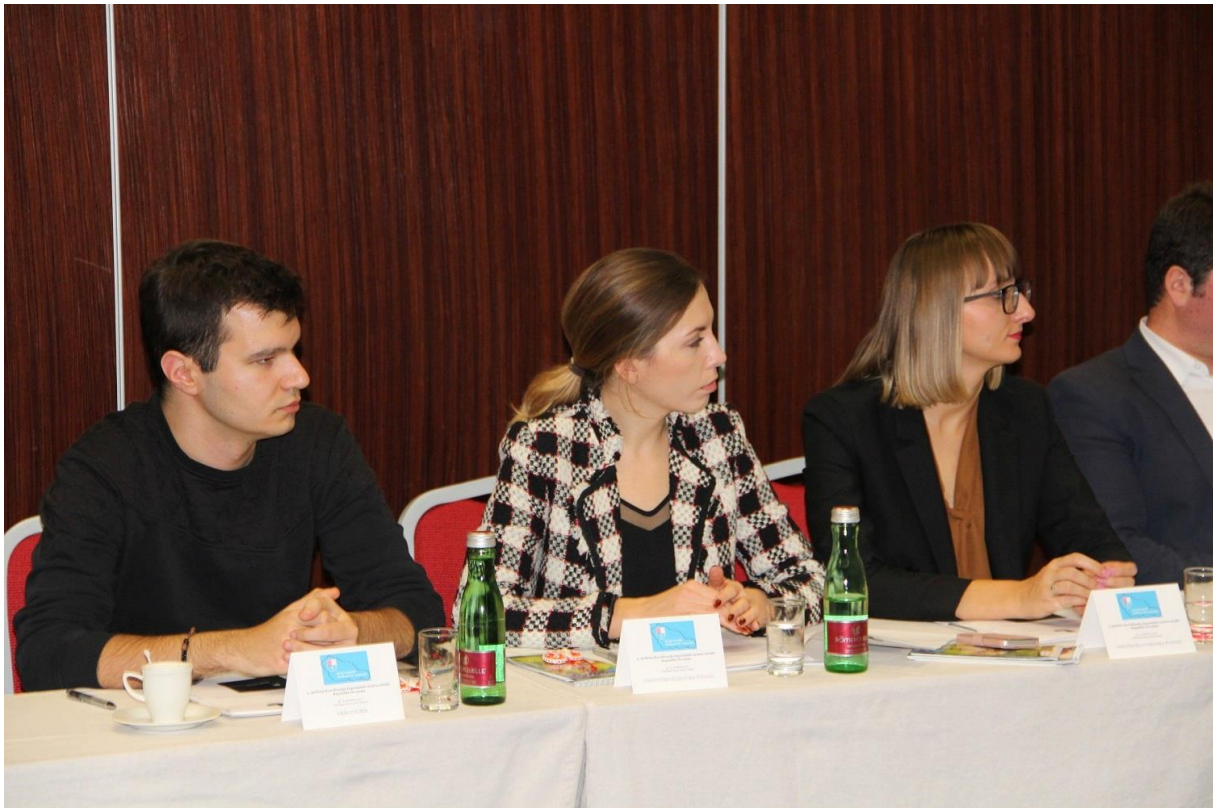
Fotografija 10. – 5. sjednica Koordinacije županijskih savjeta mladih