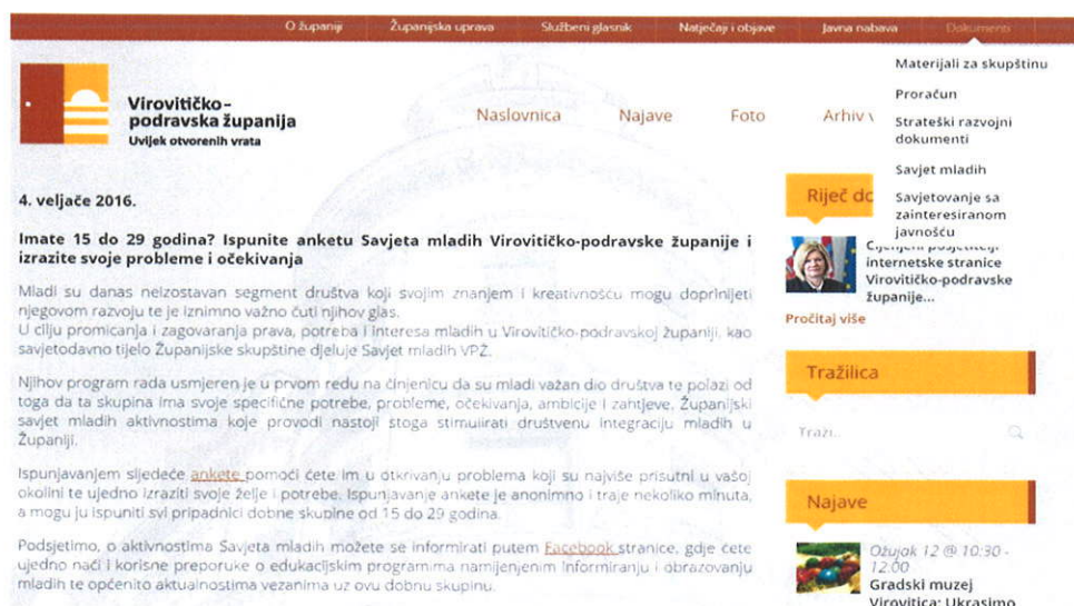
Fotografija 2. – Internetska stranica Savjeta mladih