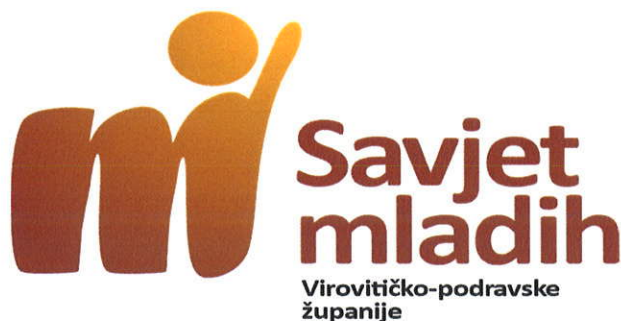
Fotografija 1. – Logo Savjeta mladih