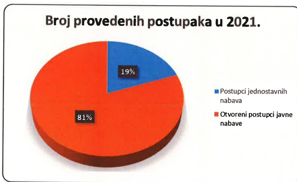
Slika 26: Struktura provedenih postupaka javne nabave u 2021. godini

Odjel za pravne poslove, ljudske resurse i javnu nabavu pružao je i isključivo savjetodavne usluge u vidu pregleda pripremljene dokumentacije o nabavi od strane korisnika, pružanje pomoći kod konkretnih problema u provedbi postupaka javne nabave (tamo gdje su korisnici samostalno provodili nabave), kao i pomoći u fazi realizacije već ranije sklopljenih ugovora o javnim nabavama.