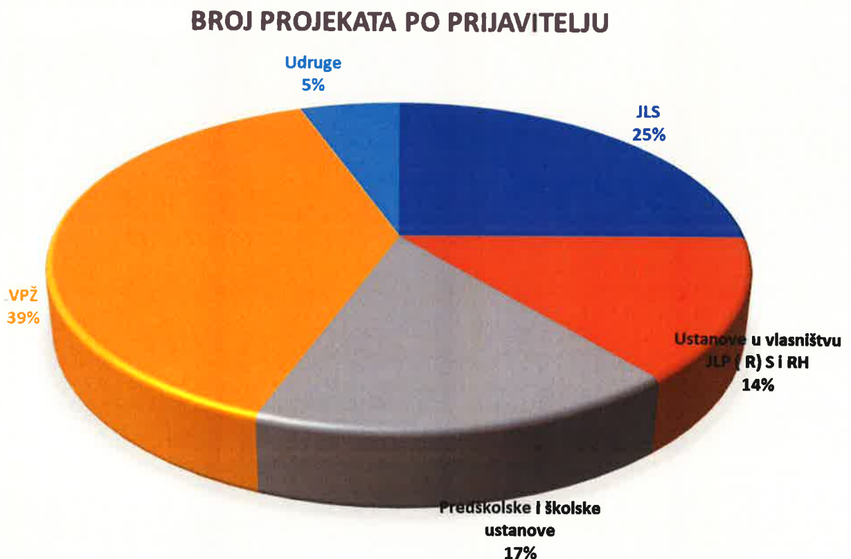
Slika 2: Broj projekata prema prijavitelju u 2021. godini

Popis svih projekata kao i njihova kratka analiza nalazi se u nastavku.